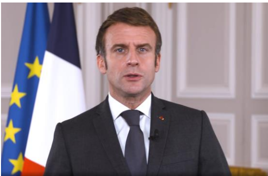
Intervention du Président de la République

lors du Sommet mondial du Partenariat pour un gouvernement ouvert, le 15 décembre 2021